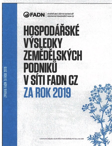
Nová podoba publikace FADN

Tak jako každý rok i letos Kontaktní pracoviště FADN CZ (Zemědělská účetní datová síť) chystá šetření dat zemědělských podniků. Za účetní rok 2019 se šetření účastnilo 1 359 zemědělských subjektů. Agregovaná data FADN jsou na národní úrovni intenzivně využívána zejména Ministerstvem zemědělství ČR pro hodnocení ekonomické situace zemědělských podniků a pro přípravu, resp. hodnocení společné zemědělské politiky.